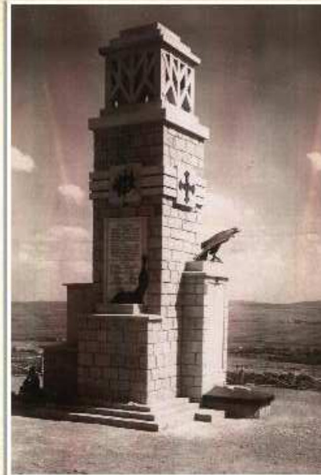
ȚIEȘI NEAMȚ – MONUMENTUL ERDILOR din primul Batalion Vânători de Munte