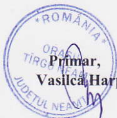
Primar, Vasilcă Harpa

Relații suplimentare se pot obține la Serviciul Resurse Umane din cadrul Primăriei orașului Tîrgu Neamț sau la telefon 0233/790245.